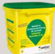
weber.tec Superflex D 24 reaktive Dickbeschichtung