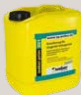
weber.prim 801 Grundierung für saugende Untergründe