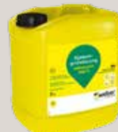
weber.prim 932 P Systemgrundierung