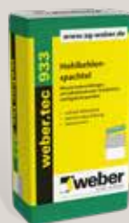
webertec 933 Hohlkehleenspachtel