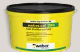
webercal 286 Kalk-Strukturspachtel