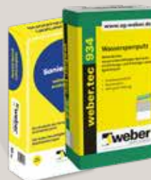
webertec 934 Wassersperrputz oder webersan evoluzione