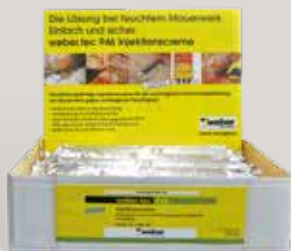
webertec 946 Injektionscreme